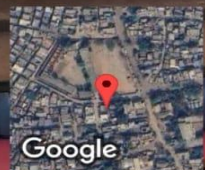
Chandrapur, Maharashtra, India Ghutakala talov Hanuman Chowk, near ravidas putla, Ghutkala Ward, Chandrapur, Maharashtra 442402, India Lat 19.950669° Long 79.289985° 06/10/23 12:32 PM GMT +05:30