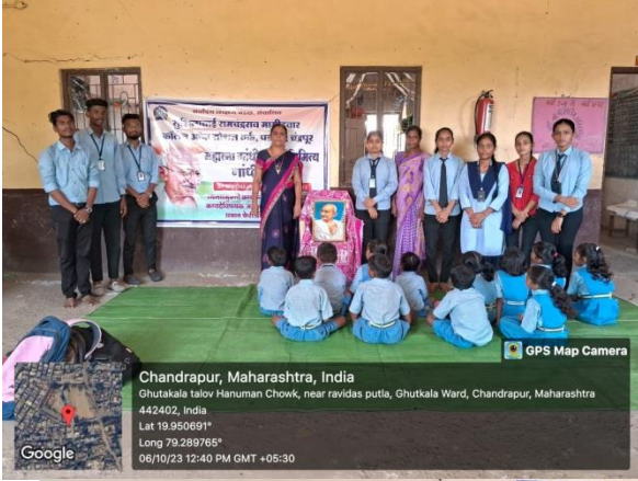
Chandrapur, Maharashtra, India Ghutakala talov Hanuman Chowk, near ravidas putla, Ghutkala Ward, Chandrapur, Maharashtra 442402, India Lat 19.950691° Long 79.289765° 06/10/23 12:40 PM GMT +05:30