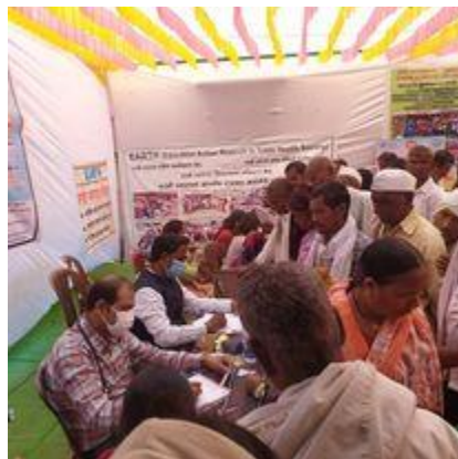
77 दिव्यांगांचा पाहू तुम्हाला स्वस्थ जांच 13 चिकित्सकों ने किया उपचार

6) Evidence of success :- health outcomes such as the number of participants screened for various health conditions, the detection rate of disease, and improvement in health and the detected patients were referred for follow-up care. The participated patients were satisfied with the services provided and were willing to attend future health check up camps. Students acquired great learning experience personal growth and skills related to community engagement and health promotion.