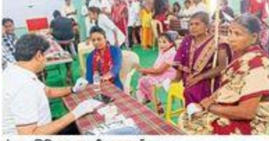
चंद्रपूर : शिबिरात तपासणी करताना डॉक्टर.